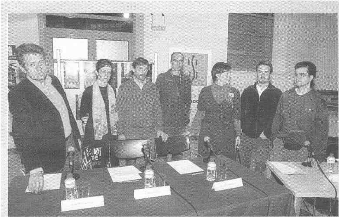
Mesa redonda sobre la bicicleta urbana. El Museo de Historia de la Automoción acogió ayer una mesa redonda sobre “La ciudad y sus barreras. La bicicleta y sus ventajas” donde se abordó el tema de la movilidad urbana ./GUZÓN