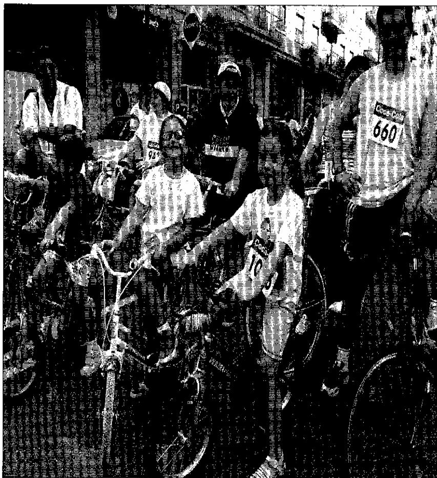
Algunos participantes en la anterior edición del Día de la Bici.

Para elaborar este plan Guardabarros ha realizado un estudio, que ha entregado a la institución académica y del que se desprenden tres conclusiones fundamentales para la mejora de estas infraestructuras. Por una parte, que el diseño debe permitir la posibilidad de candar cómodamente las dos ruedas y el cuadro (el actual sólo permite sujetar la rueda delantera, lo que daña la